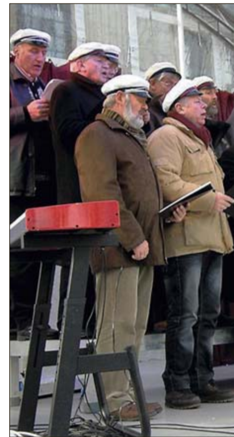
Drøbak Mannskor samlet ved granen fra Frogn

Første helg i advent dro et nesten fulltallig Drøbak mannskor til Berlin for å synge ved Brandenburger Tor når julegrana fra Frogn skulle tennes.